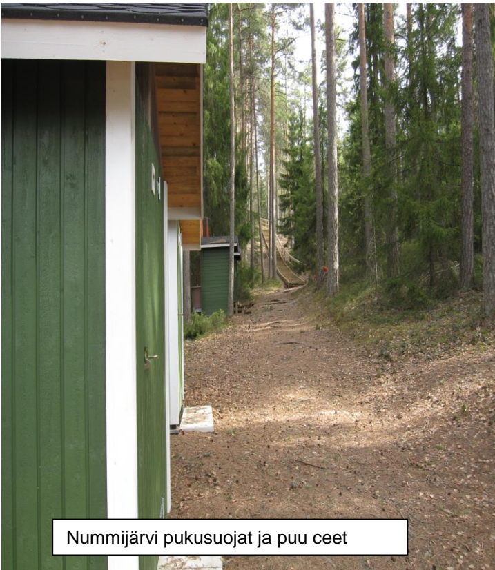
Nummijärvi pukusuojat ja puu ceet